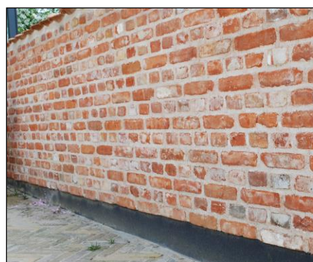
Varenr. MS0110 og MS0112